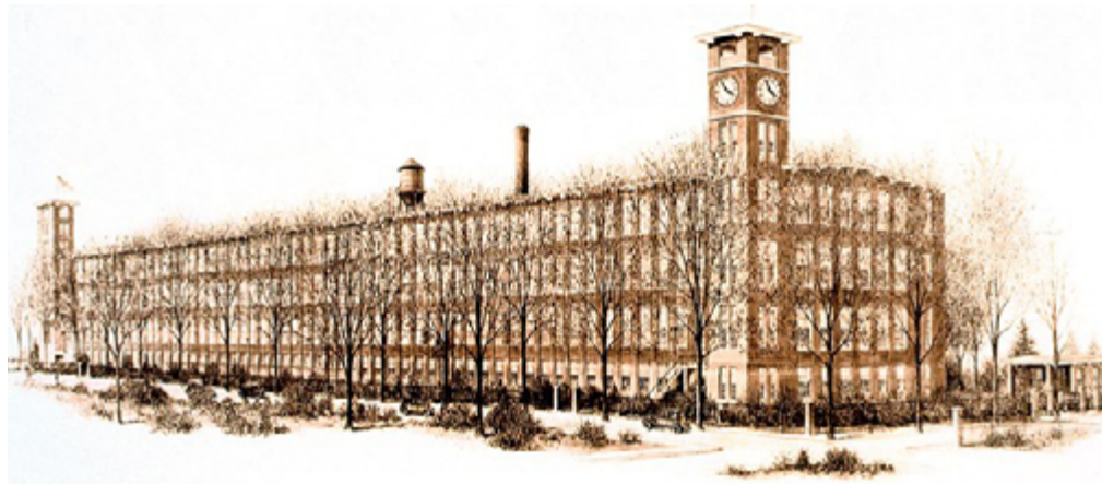
ایسٹ رتھرفورڈ، نیو جرسی (1906)، کمپنی کا پہلا کارخانہ اور تنظیمی ہیڈکوارٹر