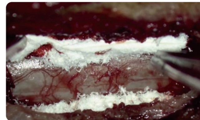
硬膜外静脈叢における出血への適用例

脊椎脊髄外科、脳神経外科、泌尿器科、心臓血管外科、一般外科手術など、局所止血が適応となる様々な手術に使用できます 2) 。