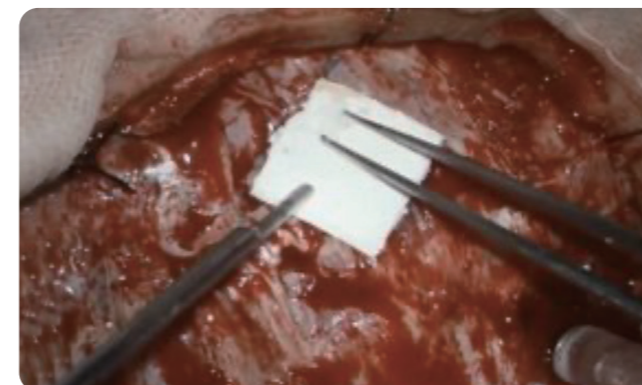
硬膜内静脈洞における出血への適用例