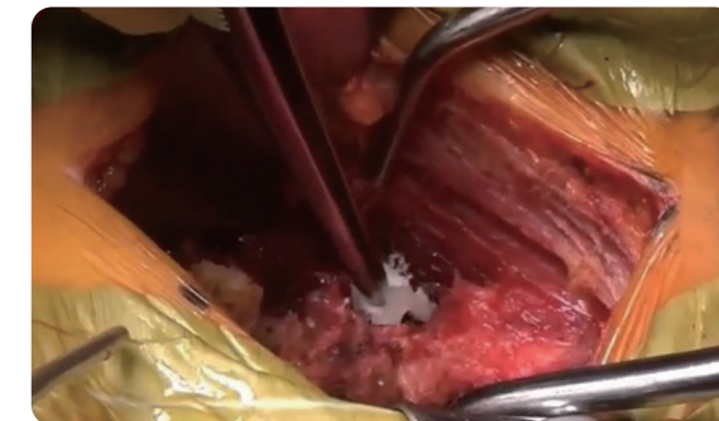
骨と軟部組織からの出血への適用例