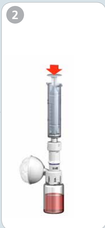
2. Håll flaskan upprätt och spruta ned spänningsvätskan eller luften i flaskan.