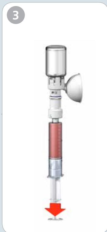
3. Vänd systemet upp och ned och aspirera läkemedlet.