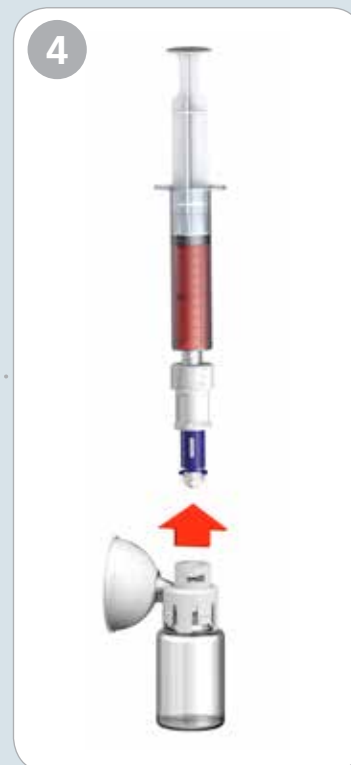
4. Koppla ifrån. Dra - vrid - dra.